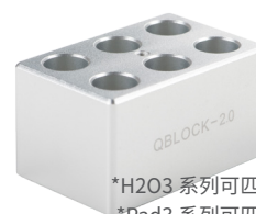
*H203 系列可匹配 4 个模块 *Pad3 系列可匹配 2 个模块